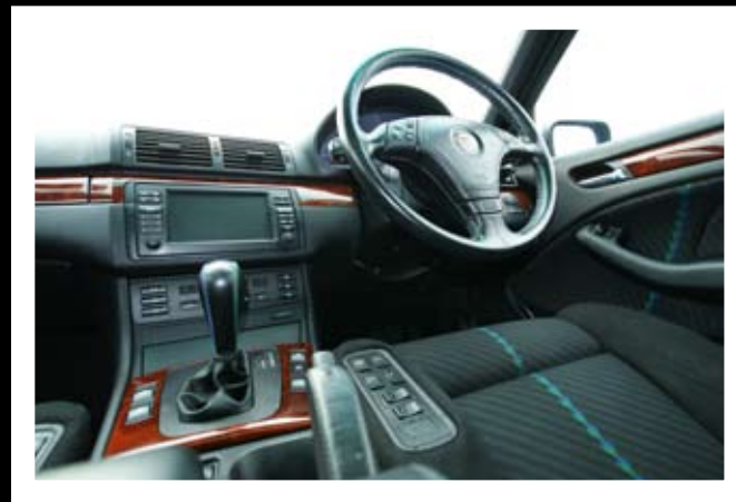
■ ดูเอาเอง...เขียน ALPINA คงรู้ว่าขึ้นไหนหายากสุด

ซึ่งที่เป็นแบบนี้ก็เพราะว่า แบนด์ ALPINA เค้าไม่ค้าขายอะไหล่ตัวรถ คุณจะซื้อของเค้าได้ก็แค่ล้อเท่านั้น ส่วนอย่างอื่นหมดสิทธิ์ เพราะเค้าขายรถเป็นแบบ COMPLETE CAR ครบ ซึ่งถ้าจะเบิกอะไหล่ คุณต้องมี “นัมเบอร์ตัวรถ” ที่ออกจาก ALPINA เท่านั้น ถึงจะมีสิทธิ์ซื้ออะไหล่ส่วนต่างๆ ได้