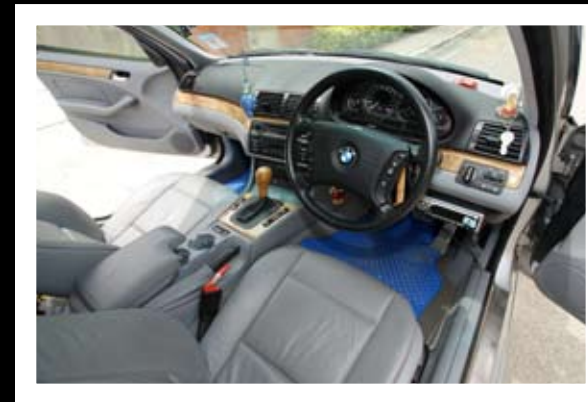
■ ออปชั่นครบ มาตรฐานโรงงาน