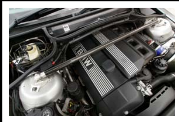
■ ห้องเครื่องสะอาด เดิมๆ พ่วงแค้นกรอง SIMOTA

หล่อแรกเลยด้วยตัว “ไมเนอร์เซนจ์...ไฟเซิด...โคมสุดท้าย” ของคุณ “WEE_VISA” หนึ่งในสมาชิก BMW SOCIETY เป็นอีกบุคคลหนึ่งที่หลงใหลมนต์เสน่ห์รถบาวาเรีย ซึ่งก่อนที่จะเป็นอย่างที่เราเห็นนี้ เจ้าคันนี้เคยเป็น “AC SCHNITZER” มา