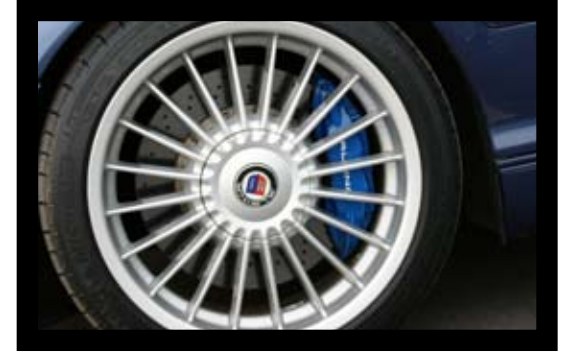
■ ล้อรุ่นใหม่ ลายของเดิม แต่ฝามีลาย

สำหรับคันนี้ต้องยอมรับว่าเข้าขั้น “เทพ” เก็บทุกเม็ดจริงๆ เริ่มจากภายนอกเป็น AERO DYNAMIC รุ่นแรกของ ALPINA E46 กันชนหน้าจะเรียกว่า TYPE 193 ส่วนกันชนหลังเรียก TYPE 195 ซึ่งยังมีอีกมากมายนะครับ แต่เค้าแบ่งออกตามรุ่นๆ อาทิ ไมเนอร์เชนจ์, คูเป้, ซีดาน หรือ เปิดประทุน ก็มีกันชนหน้า-หลังตามรุ่นของมัน นอกจากกันชนแล้ว ยังมีการคาดสาย ALPINA ตามแบบต้นฉบับทั้งคัน