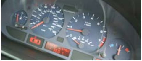
■ มาตราวัด ALPINA เค้าเคลมถึง 300 กม./ชม.

ดังนั้น การที่จะทำรถให้เป็น ALPINA ตัวเต็ม คงเป็นเรื่องที่เหนื่อย!! ไม่ใช่ซี..ต้องบอกว่า “โค...รเหนื่อย!!” น่าจะถูกมากกว่า เพราะคุณต้องตามล่าหาของจากรถที่ประสบอุบัติเหตุ มั้ง หรือไม่ก็รถที่เค้าเอามาล้มอะไหล่ขายบ้าง ถึงจะมีสิทธิ์ได้ของ แล้วมีผู้คนเดียวซะที่ไหนที่อยากได้ ยังมีแฟนพันธุ์แท้ ALPINA จ้องรอตาเป็นมัน แล้วมันจริงอย่างที่ผมบอกไหมล่ะว่า โค...รเหนื่อย!!!