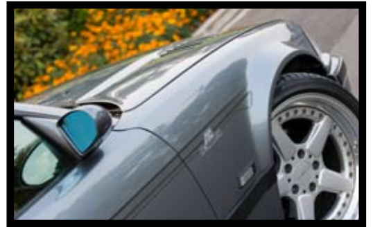
■ ฝากระโปรงจ่อช่องระบาย ส่วนกระฉกมองข้างเบิกห่าง!!!