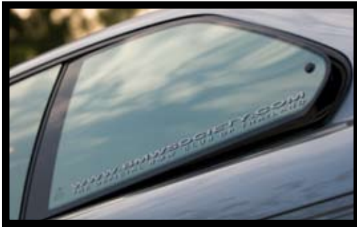
■ บานโอเปอเร้า เสน่ห์รถ Coupe