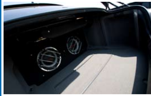
■ “สองดอกนี้” โรงงานไม่มีให้... เป็นออปชั่นเสริมตามร้านประดับยนต์