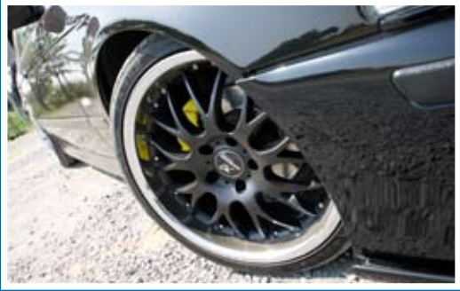
■ ล้อ Hamann ลาย Mesh สีดำของเงา จับความโหดให้กับรถขึ้นอีกเพียบ