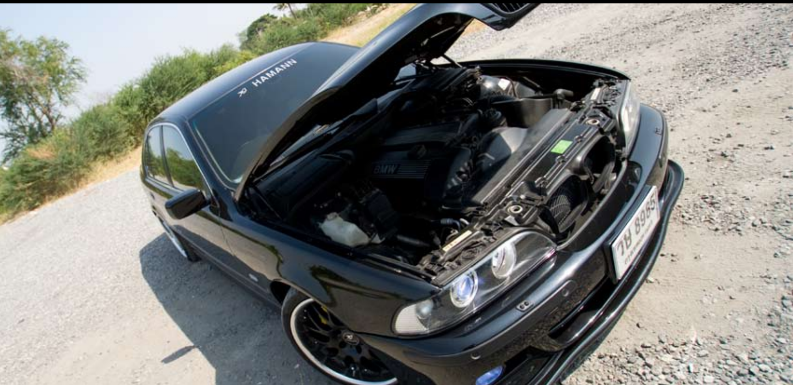
■ เดิมสนิท...เปลี่ยนแค่ของเหลวในเครื่องกับกรองอากาศก็จบแล้ว

ช่วงล่างเดิมจัดว่าดีเข้าขั้น เปลี่ยนแค่ใช้ค Bilestein กระบอกละเลียดชุดเดียวก็เพียงพอต่อการใช้งาน ส่วนล้อเลือก Hamann ขนาด 8.5 x 19 นิ้ว ยาง Falken FK452 235-35R19 ข้างหลังล้อเล็กกว่าตามสูตร ขนาด 9.5 x 19 นิ้ว คู่กับยางแบรนด์เดียวกันขนาด 265-30R19