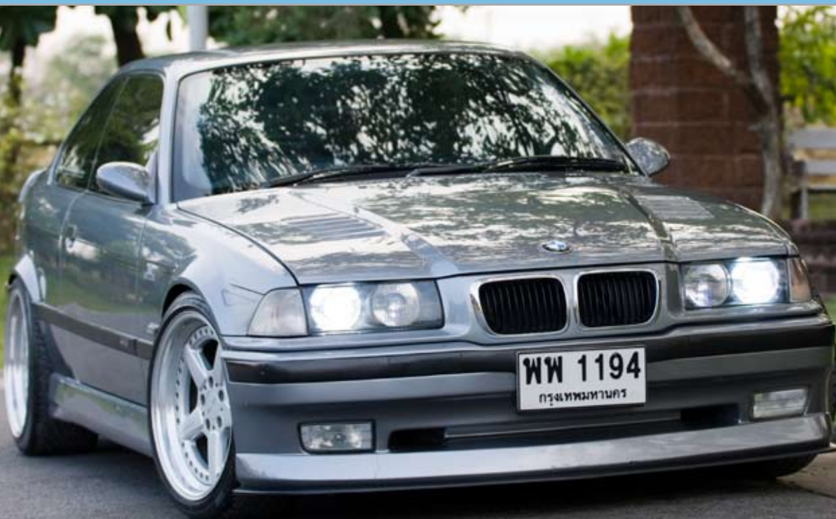
■ ใต้กันชนหน้าเป็นแนวสันเล็กๆ คือ “Front Lip” ที่สร้างขึ้นใหม่